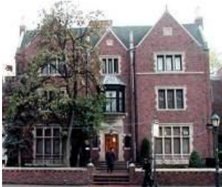
770 — Дом Мошиаха

(Гиматрия слов צרפת и בית משיח (букв. «Дом Мошиаха») равна 770. Слово «царфат» состоит из букв פ пей (числовое значение – 80), ר рейш (200), צ цади (90) и ת тав (400). Всего – 770. Выражение «Бейт Мошиах» состоит из букв ב бейт (2), י йуд (10), ת тав (400), מ мем (40), ש шин (300), י йуд (10) и ח хет (8). Всего – 770).