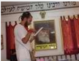
Бейт Хабад Дели (Индия)