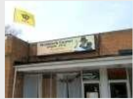
Чикаго, Мошиха центр