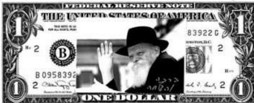
Доллар от Ребе

...В воскресенье, прямо с утра, вокруг «770» предприимчивые коммерсанты ставили небольшие палатки, чтобы стоящие по многу часов в очереди посетители могли выпить стакан кофе и что-нибудь перекусить. Большинство таких палаток имело в своем распоряжении ламинаторы.