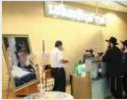
Дом Хабада в аэропорту Бен-Гурион