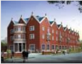
Самый большой Дом Хабада в мире