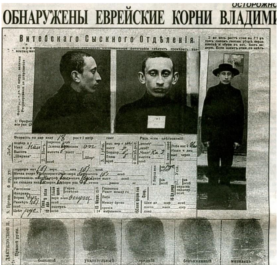
Єврейські корні Путіна – останнього царя Великої Хазарії?

А якщо ми подивимось на матеріали другої публікації російських націоналістичних видань вже в Росії, то нам стане повністю зрозумілим, чому керівництво Росії робить ставку в Україні саме на південносхідну її частину – центральну частину колишньої Хазарії, де хазари, аналогічно Московії, зберегли свою владу і мають найпотужніший вплив здавен до цього часу.