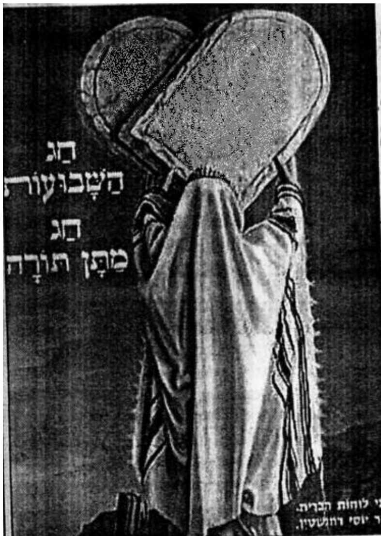
Время дарования Торы

Не знає наш народ і про головне значення символіки БЮТ – про кам'яне “сердечко”.