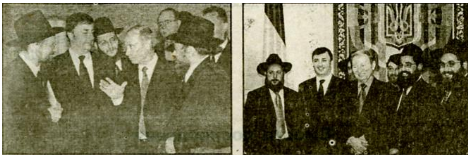
Путін і Кучма в оточенні хабаду

Таким чином, повністю розвінчуються всі сучасні легенди і міфи сіонізму на теренах всього Євразійського і Світового просторів. Київська Русь розпочинає незупинну ходу у звільненні від прихованого і ненажерливого окупанта, найжорстокішого за всі часи загарбника, агресора і нещадного поневолювача майже всіх народів Америки, Європи, Африки, Близького Сходу... Потрібно віддати належне і видатному досліднику сучасної геополітичної гри, яка вражає своїми масштабами, за значний внесок у викриття цієї таємної змови проти людства харків'янину, справжньому єврейському патріоту Е. Ходосу. Таких євреїв, які своєю нелегкою практичною справою і ризиком для власного життя, довели відданість і безмежну любов до України та її народу, українці ніколи не забудуть. Вже скоро прийде час і прізвища таких людей навечно будуть внесені в Золоту книгу історії України.